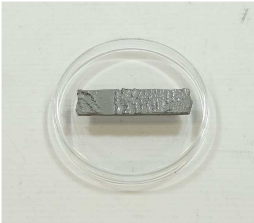
A001: EGOBON, Band