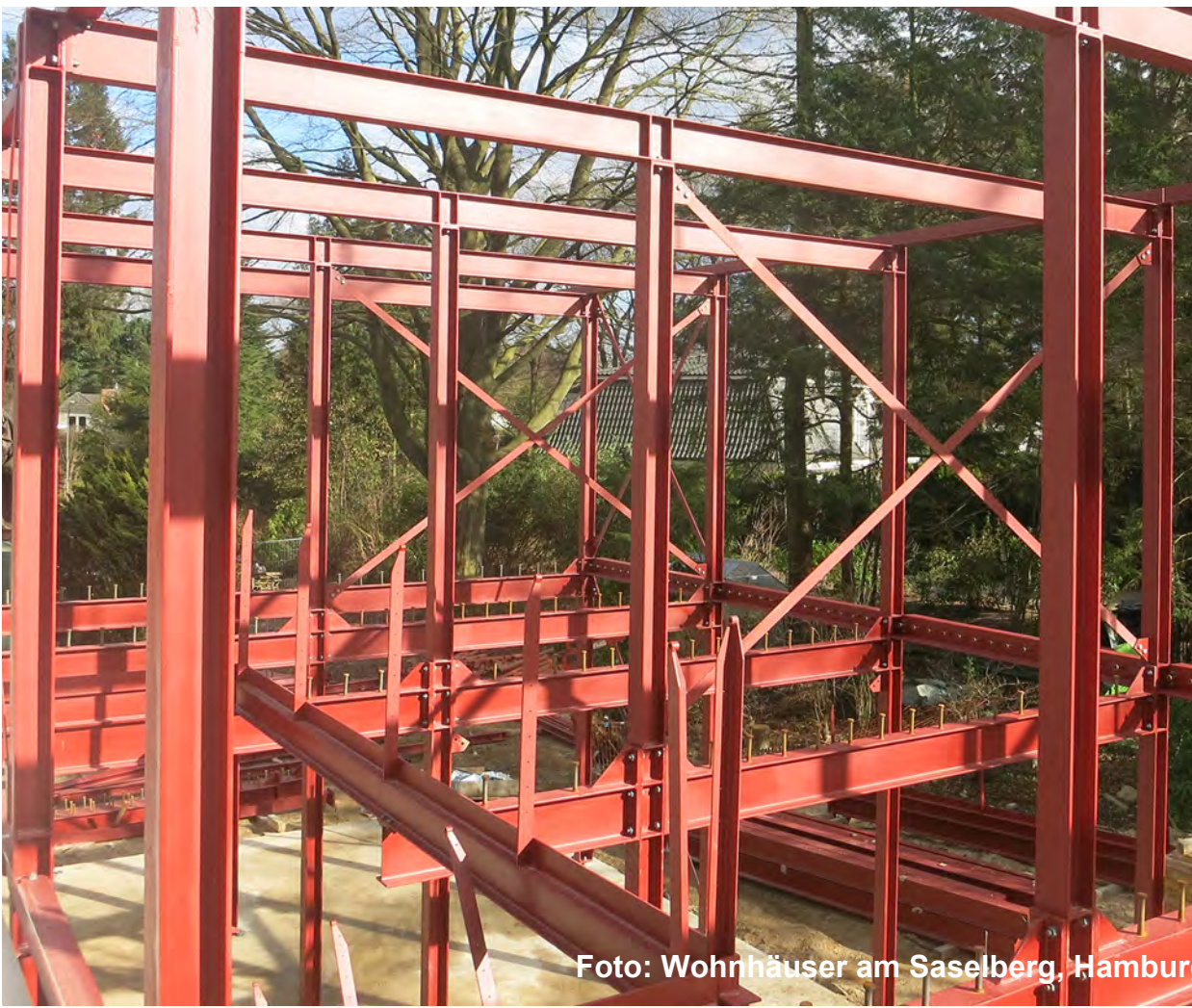
Foto: Wohnhäuser am Saselberg, Hamburg, Schulitz Architekten