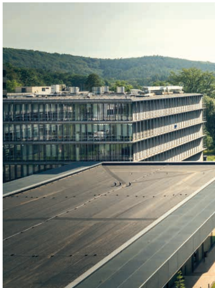
Universität des Saarlandes, Saarbrücken