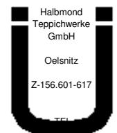
Emissionsgeprüfter Bodenbelag nach DIBT-Grundsätzen

Technische Veränderungen, die der Qualitätsverbesserung dienen, behalten wir uns vor. Bei Velour-Teppichböden können in seltenen Fällen - ohne die Gebrauchstauglichkeit zu beeinträchtigen - bleibende Schattierungen (Shading) auftreten, deren Ursache nicht material- oder konstruktionsbedingt ist. Hierfür kann deshalb keine Gewährleistung übernommen werden.