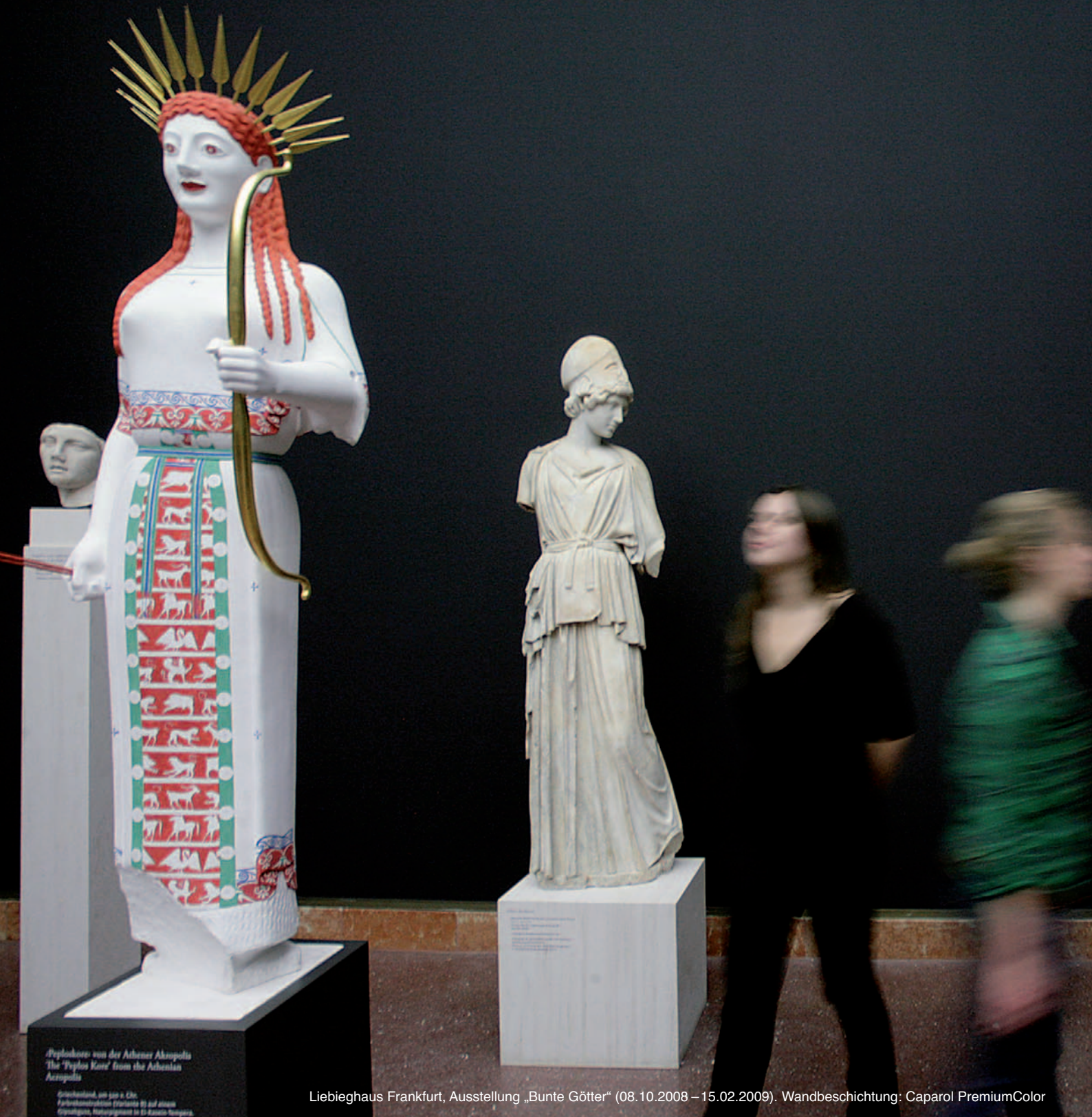
„Peplokothe“ von der Athener Akropolis The „Peplos Kore“ from the Athenian Acropolis

Griechenland, um 460 v. Chr. Felsentwürfe (Parthenon) im Hof des Epistyle, Restaurierung in El-Raschid-Tempel.