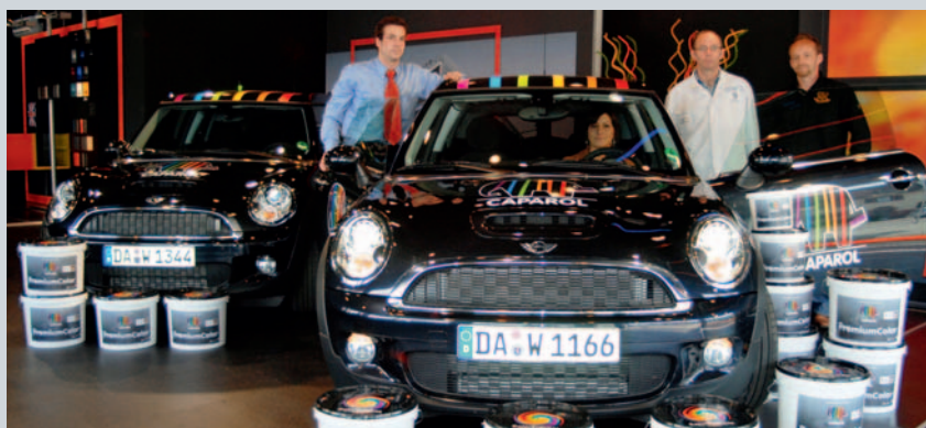
Showroom Autohaus, Kaiserslautern. Wandbeschichtung: PremiumColor

Alle weiteren Angaben können Sie der technischen Information Nr. 382 entnehmen.