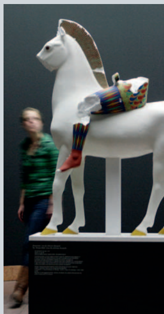
Ausstellungsansicht „Bunte Götter“. Die Farbigkeit antiker Skulptur. Wandbeschichtung: PremiumColor