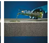
Säure- und chemikalienbeständig